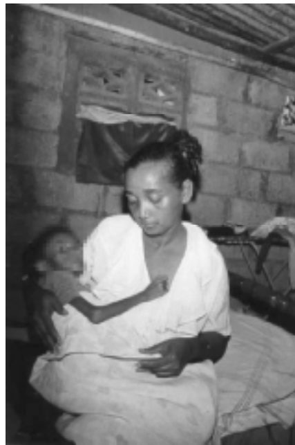
Publicado con autorización.