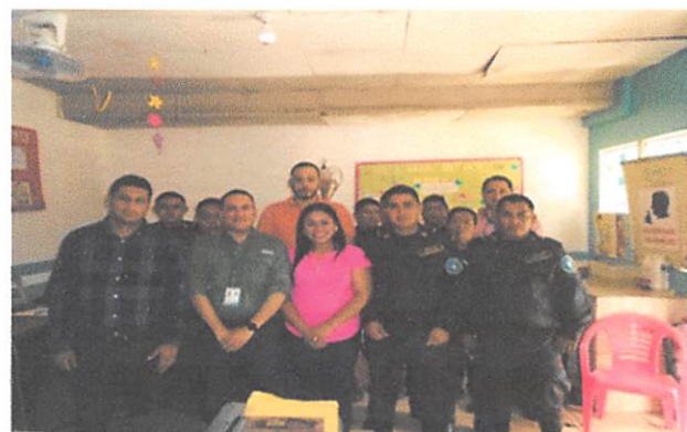
Personal Participante en las jornadas de capacitación en DDHH de los CPS de Tela y Olanchito