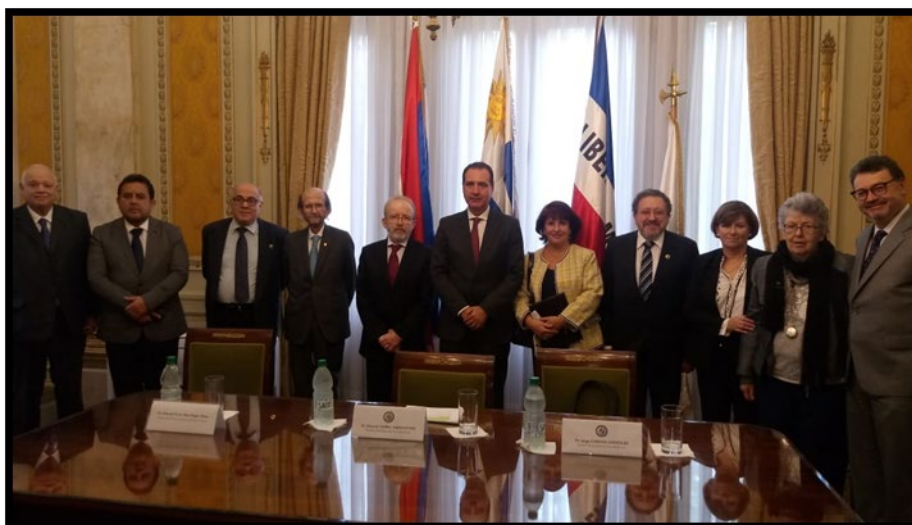
Suscripción de Convenio con la Suprema Corte de Justicia de Uruguay